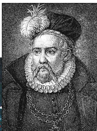
TYCHO BRAHE, 1546-1601. Dansk adelsmand, astronom, astrolog og alkymist. Den 11. november 1572 fik han i stjernebilledet Cassiopeia øje på "det største under, der har vist sig i hele naturen siden verdens skabelse", som han skrev. Han troede at have set en ny stjerne. I dag ved vi, der var tale om en døende stjerne. Men Tycho Brahes opdagelse rokkede ved kirkens fasttømrede dogme om en uforanderlig stjernehimmel fyldt med fiksstjerner placeret én gang for alle af Vorherre selv. Den ny erkendelse gav startskud til et nyt verdensbillede baseret på viden i stedet for tro.