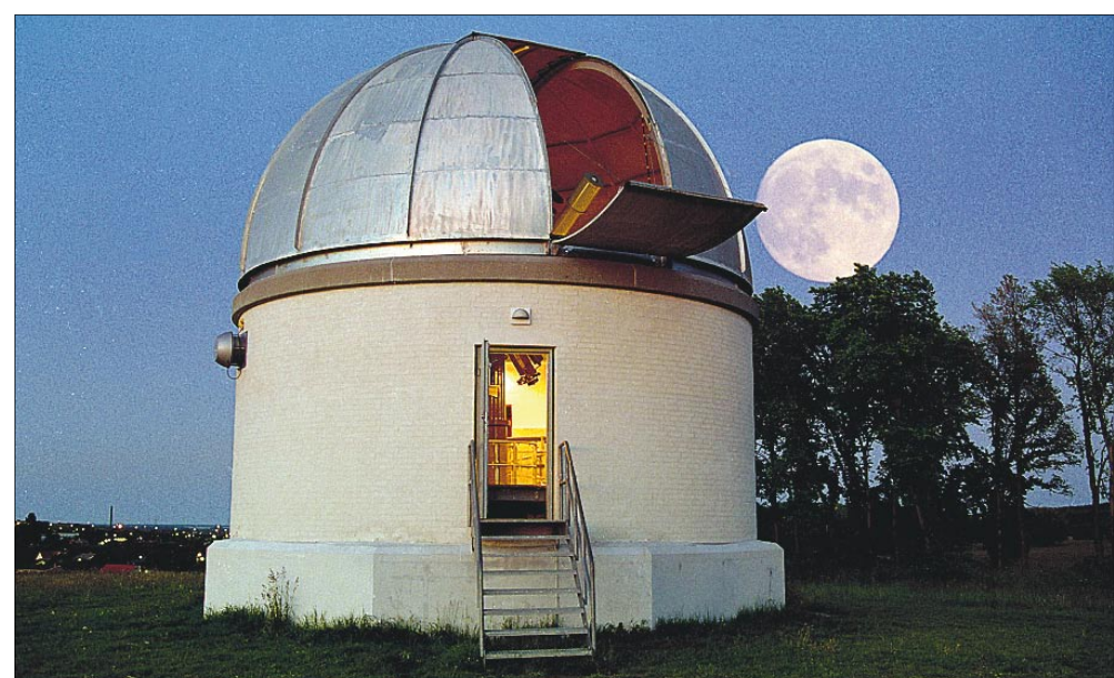
URANIA OBSERVATORIET er godt sted at nyde stjernehimlen.